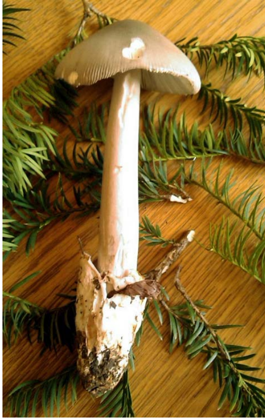
prise avec un téléphone portable