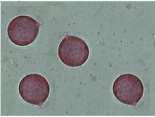
Spores x 1000 (dans phloxine)