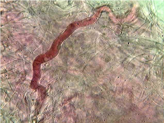
Hyphe oléifère x 1000 (dans phloxine)