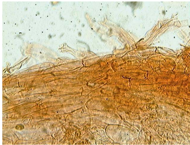
Cuticule x 400 (dans le congo)