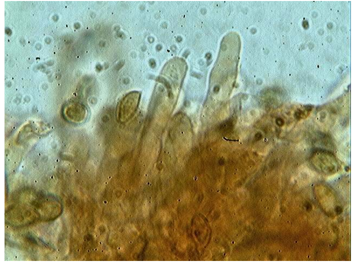
Cheilocystides x 1000 (dans le congo)