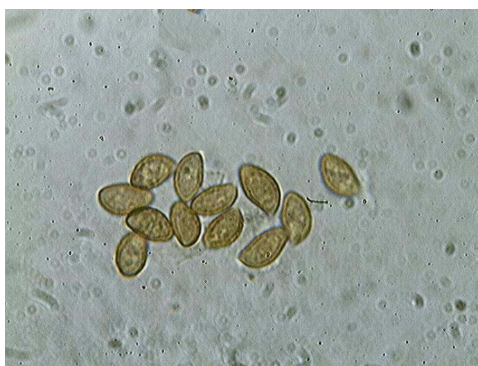
Spores x 1000 (dans KOH)