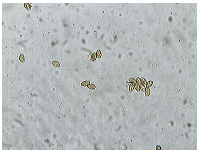
Spores x 400 (dans KOH)