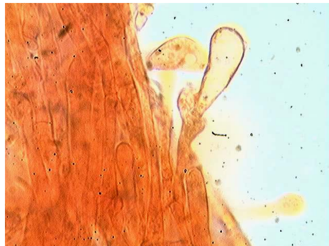
Cheilocystide x 1000 (dans le congo)