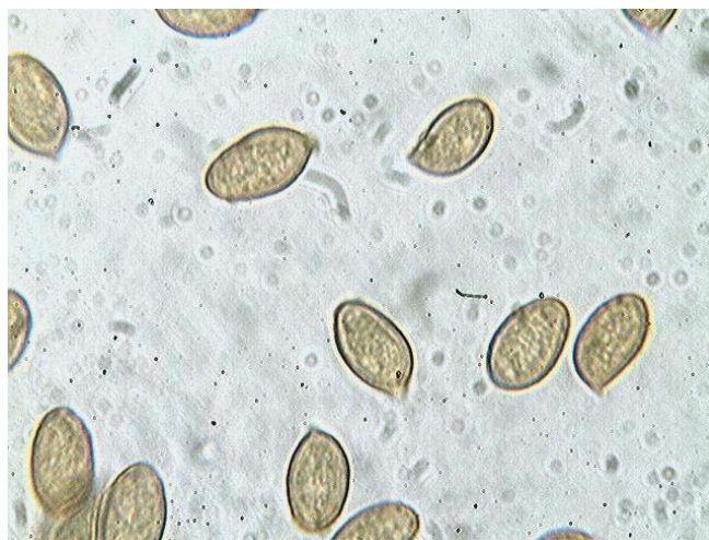
Spores x 1000 (dans KOH)