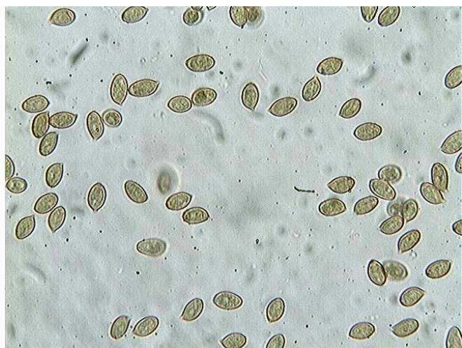
Spores x 400 (dans KOH)