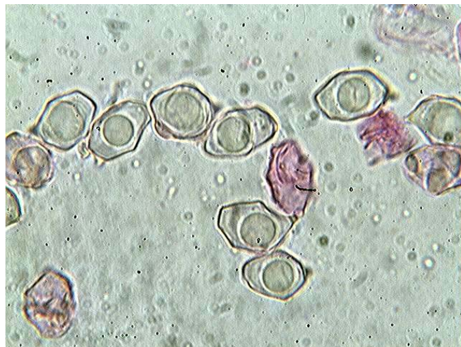
Spores x 1000 (dans la phloxine)