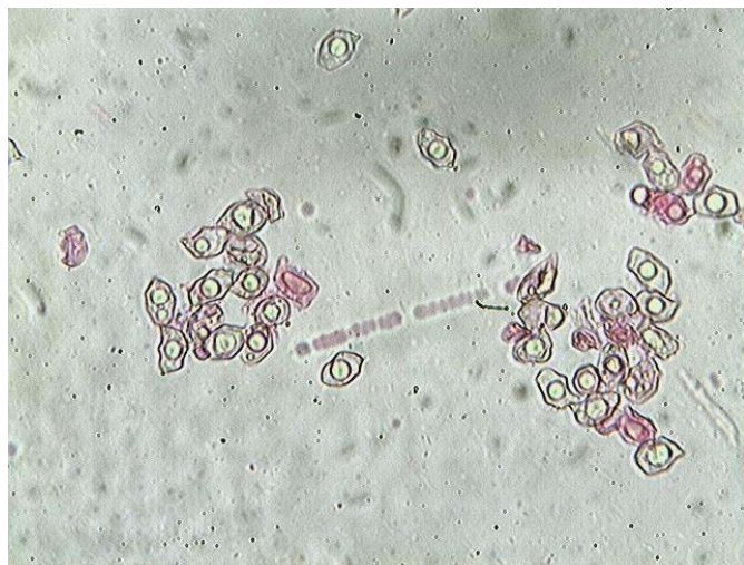
Spores x 400 (dans la phloxine)