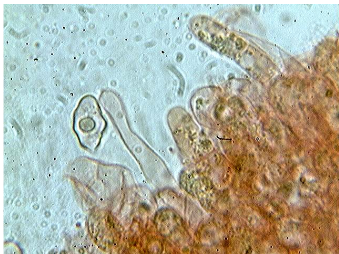
Cheilos et spore x 1000 (dans le congo)