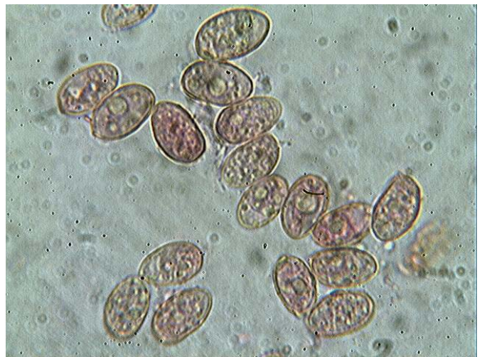
Spores x 1000 (dans la phloxine)