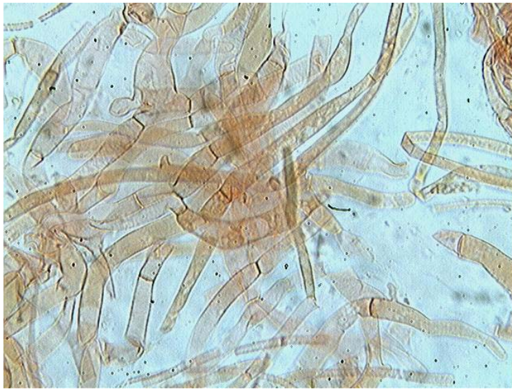
Hyphes de la cuticule