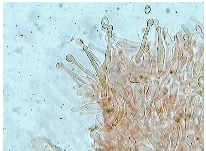
Cheilocystides x 400 (dans le congo)