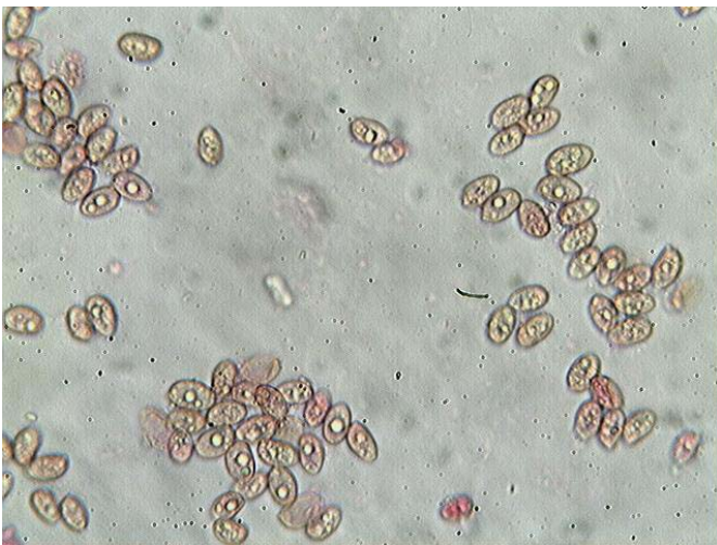
Spores x 400 (dans la phloxine)