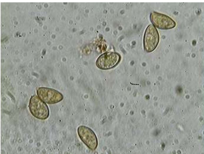
Spores x 1000 (dans l'eau)