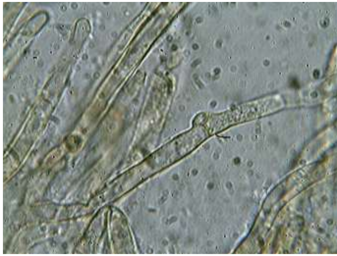
Hyphes de la cuticule x 1000 (dans l'eau salée)