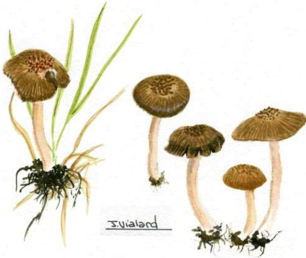
Planche de Jean Vialard