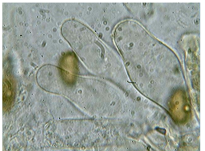
Poils marginaux x 1000 (dans la potasse)