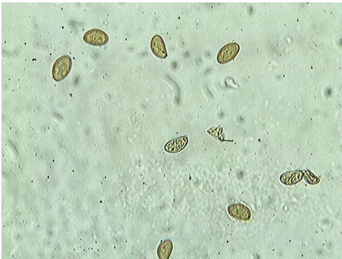
Spores x 400 (dans l'eau)