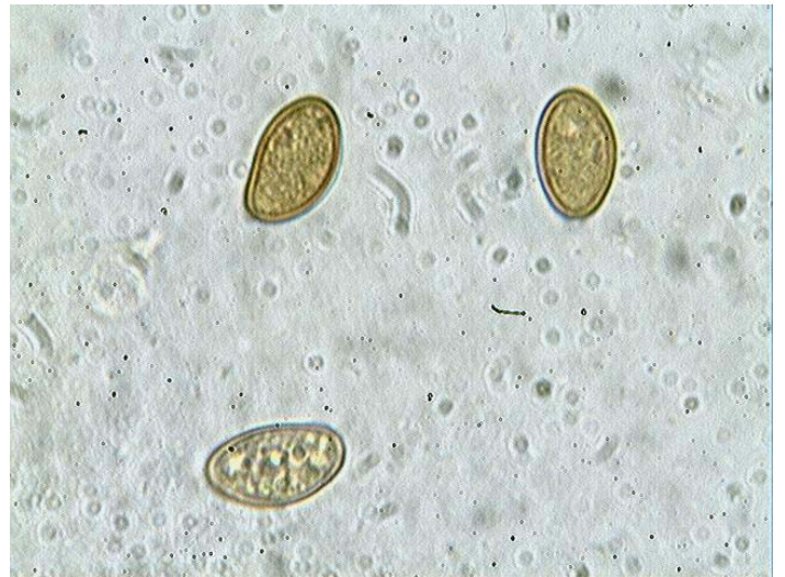
Spores x 1000 (dans la potasse)