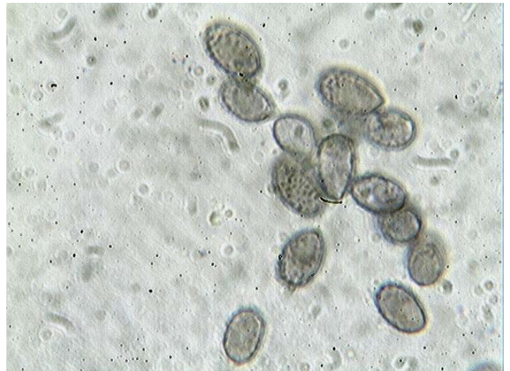
Spores x 1000 (dans le melzer)