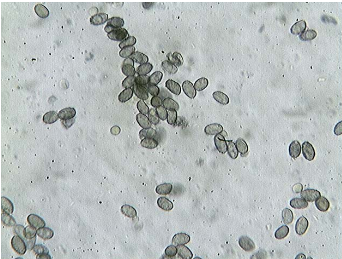
Spores x 400 (dans le melzer)