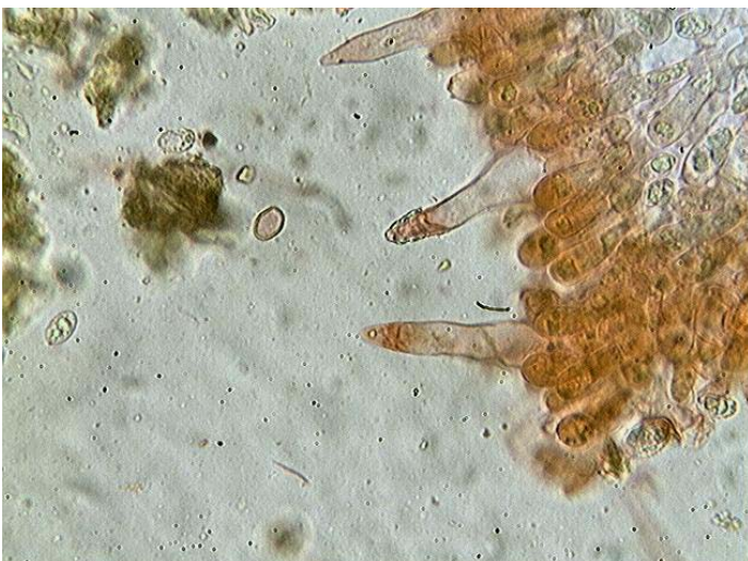
Cystides x 400 (dans le congo)