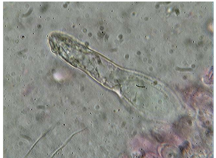
Cystide x 1000