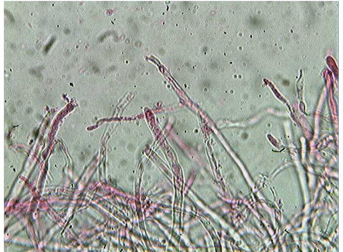
Cuticule x 400 (dans la phloxine)