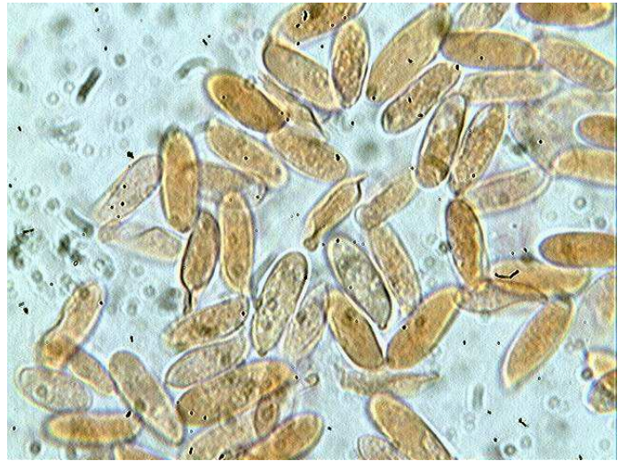
Spores x 1000 (dans le congo)