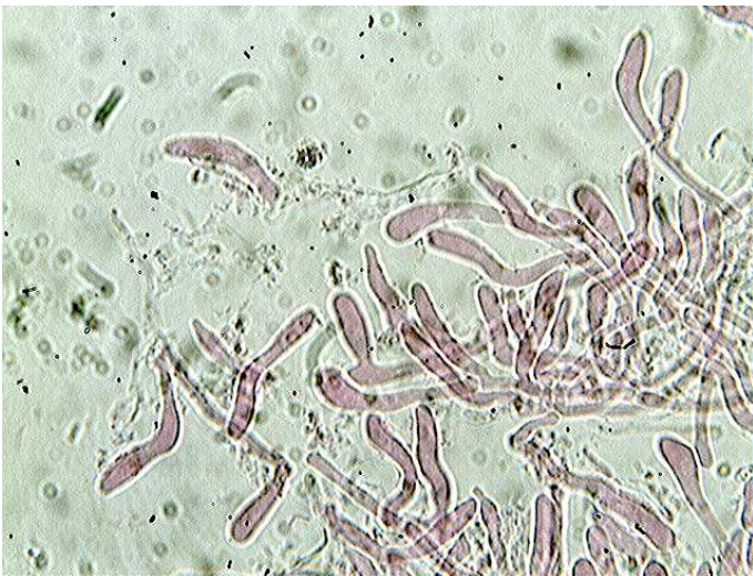
Arête des lames x 400 (dans la phloxine)