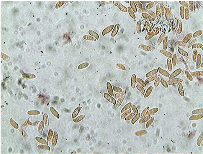
Spores x 400 (dans la phloxine)