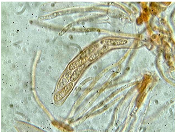
Asque et paraphyses x 1000 (dans le melzer)