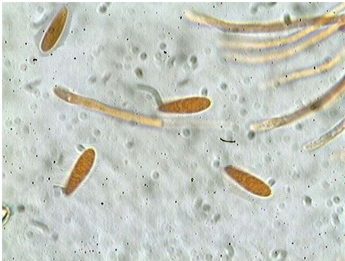
Spores x 1000 (dans le congo)