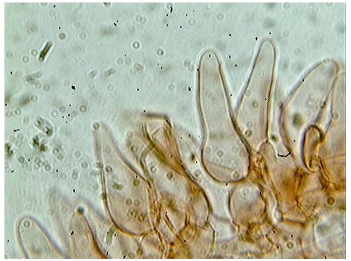
Cheilocystides x 1000 (dans le congo)