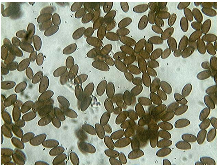
Spores x 400 (dans l'eau)