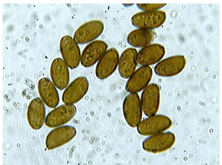
Spores x 1000 (dans l'eau)