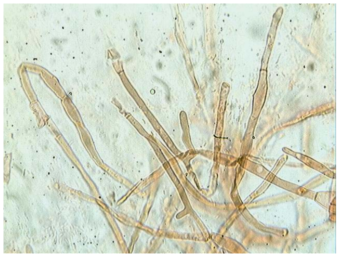
Cuticule x 400 (dans le congo)