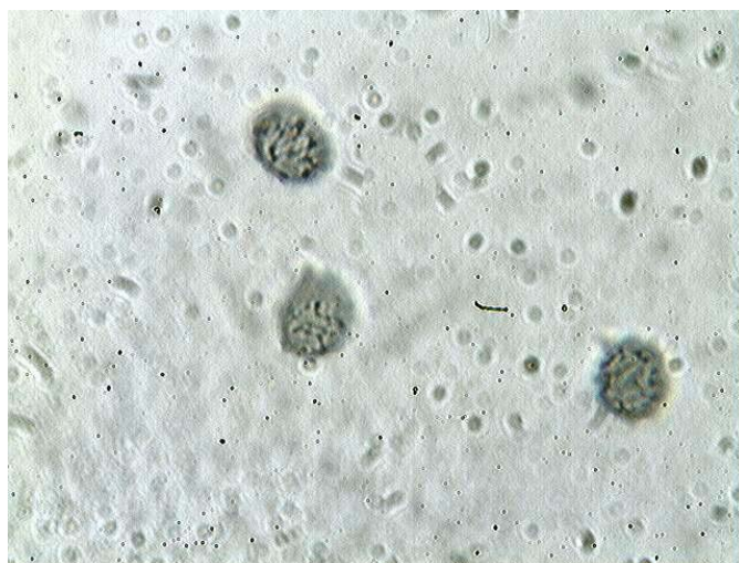
Spores x 1000 (coupe et vue de dessus)