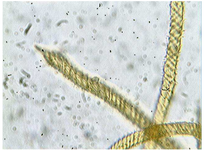
Elatères x 1000 (dans l'eau)