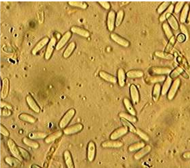
Conidies x 400 (dans le congo)