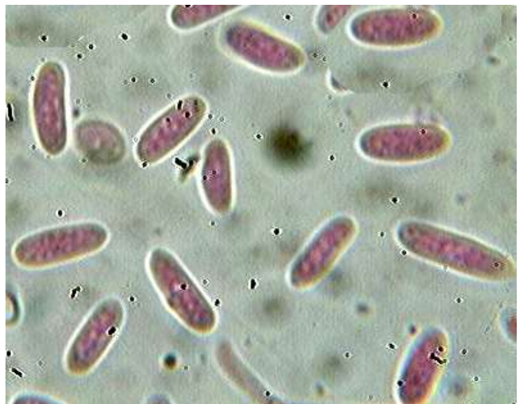
Conidies x 1000 (dans la phloxine)