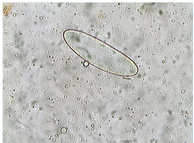
Spore x 400 (dans congo)