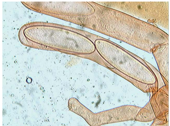
Asque x 400 (dans congo)