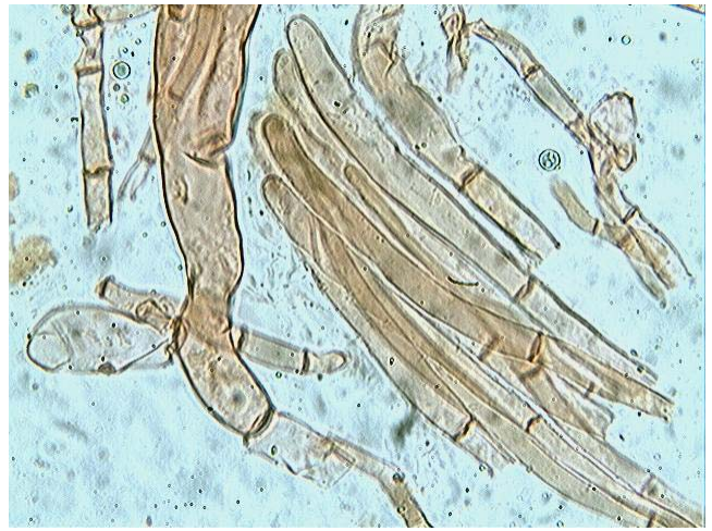
Paraphyses x 400 (dans congo)