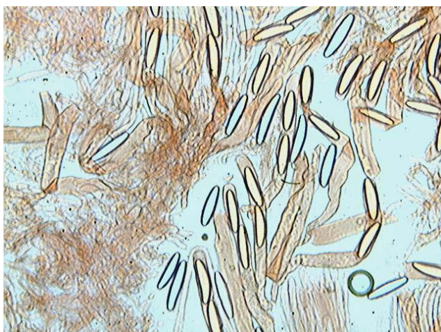
Spores x 100 (dans congo)